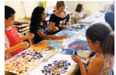
Les participants en pleine activité.

Tout ceci s'est déroulé dans la bonne humeur et le partage.