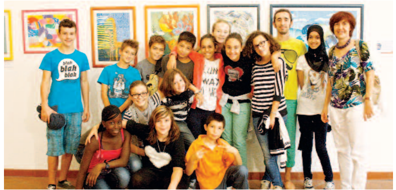
Lors de notre séjour, des classes sont venues profiter d'une visite guidée de l'exposition.