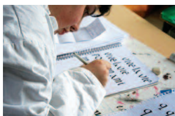
La calligraphie demande de la concentration et de la patience.

Parmi toutes les inventions humaines, l'écriture est sans conteste l'une des plus fascinantes. Sous sa forme calligraphique, elle est la rencontre de l'Art et de l'Écriture, et devient par conséquent l'Art de l'Écriture.