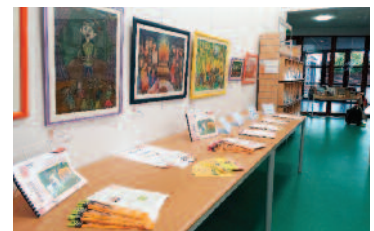
Exposition "Il était une fois..." à la Bibliothèque de Creney.

En 2014, une trentaine de lieux d'expositions sont prévus dans la région. Grâce à un logiciel d'inventaire des créations, les thèmes annuels vont pouvoir se croiser et donner naissance à des expositions inédites.