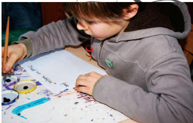
Le brou de noix est utilisé en guise d'encre.

Après cette introduction sur l'histoire de l'écriture, les enfants comprennent vite l'importance de l'écrit. Alors on y va, en abordant l'étude de la fondationale ( la Caroline de Johnston ), une des écritures la plus abordable pour eux.