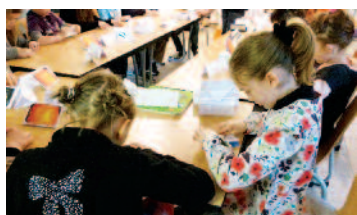
Atelier de pliage à Ervy-le-Châtel.

En premier lieu, il s'agit d'expliquer donc d'extraire les plis. Ensuite nous pourrions multiplier : plier plusieurs fois. Pour finir par dupliquer donc reproduire quelque-chose de reconnaissable, et pourquoi pas un livre. Le livre "cocotologique" nous permet ce pari, car il a pour spécificité de n'être fait qu'avec une seule feuille, donc la reliure et les pages sont un tout.