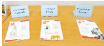
Outils pédagogiques en 3 niveaux d'âge, exposition "Il était une fois..." à la Bibliothèque de Creney.

Quatorze expositions thématiques, de 30 à 50 tableaux, peuvent être empruntées. Trois autres, comportant 70 à 160 tableaux, sont exceptionnelles et s'ajoutent aux possibilités offertes par le Centre pour l'UNESCO. Chaque exposition est un moment de partage nourri par les expériences de chacun.