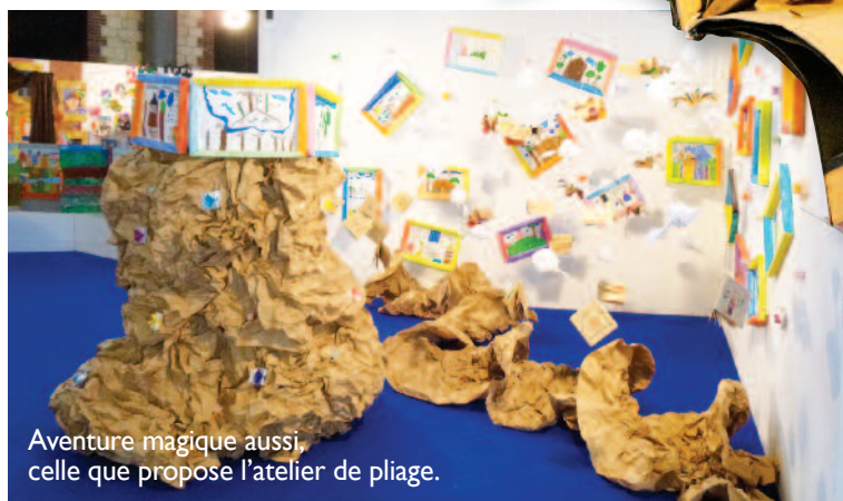
Aventure magique aussi, celle que propose l'atelier de pliage.

Comme dans un livre, au fil des pages, de plis montagnes en plis vallées, nous partons à la découverte du monde, à la découverte des mots. Comme s'ils lisaient un livre, ils se retrouvent dans un autre temps, celui