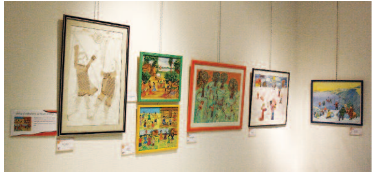
Exposition "Jeux et Jouets" à la MJC de Fismes.

Le Centre pour l'UNESCO ne se contente pas uniquement d'apporter chez vous une exposition unique et originale de tableaux d'enfants. Il vous conseille pour sa mise en place et met à votre disposition différents outils pédagogiques. En complément, le Centre pour l'UNESCO propose, à vos frais, des ateliers d'éveil en arts plastiques.